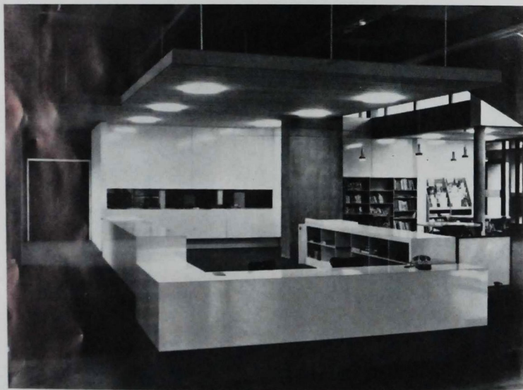
La Roche-sur-Yon. Bibliothèque municipale. Vue intérieure.